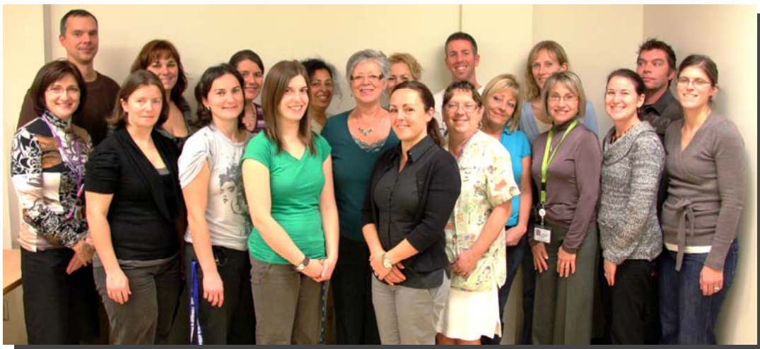
Équipe de l'unité de réadaptation fonctionnelle intensive (URFI) de Saint-Bruno-de-Montarville

Grâce au nouveau projet d'URFI réalisé en partenariat avec le CSSS Richelieu-Yamaska, l'accessibilité pour la clientèle en déficience physique desservie par le CMR est améliorée et permet une meilleure continuité de services.